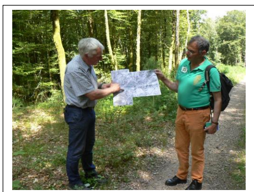
Schéma de desserte et routes « stratégiques » : Les routes stratégiques sont des voies communales ou départementales proposées pour le transport des bois, vers les scieries, dans le but de renforcer ces voies si nécessaire, de contourner les hameaux, et d'éviter des dégradations ailleurs : 210 km sont ainsi identifiés (soit 13,5% du réseau routier). Les travaux éventuels de consolidation sur voies communales sont pris en charge à 80% par des crédits européens et départementaux.