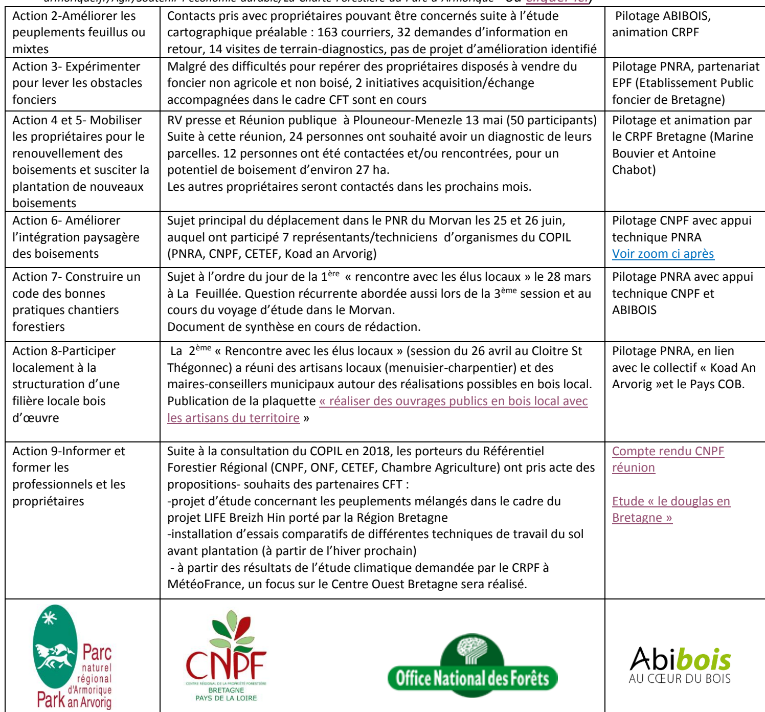
Tableau synthétique des actions engagées (référence plan d'action en ligne sur http://www.pnr-armorique.fr/Agir/Soutenir-l-economie-durable/La-Charte-Forestiere-du-Parc-d-Armorique OU cliquer ici )

A noter le départ de Marc Pasqualini, référent CFT à l'ONF, remplacé dans cette mission par Laurent Pioline.